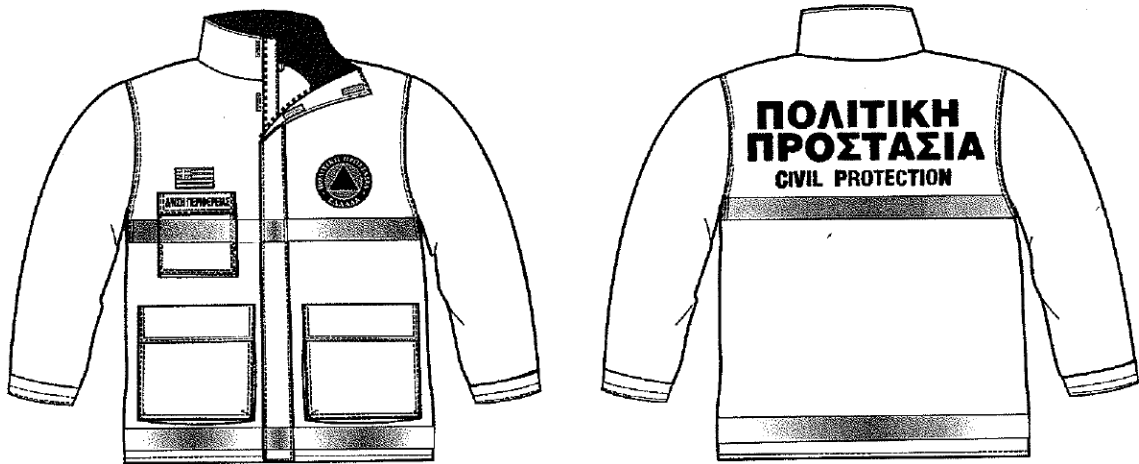
Εικόνα 1. Επιχειρησιακά μπουφάν Πολιτικής Προστασίας

Σύμφωνα με το 4678/22-11-2004 έγγραφο ΓΓΠΠ, τα επιχειρησιακά μπουφάν Πολιτικής Προστασίας θα πρέπει να έχουν την ακόλουθη μορφή: